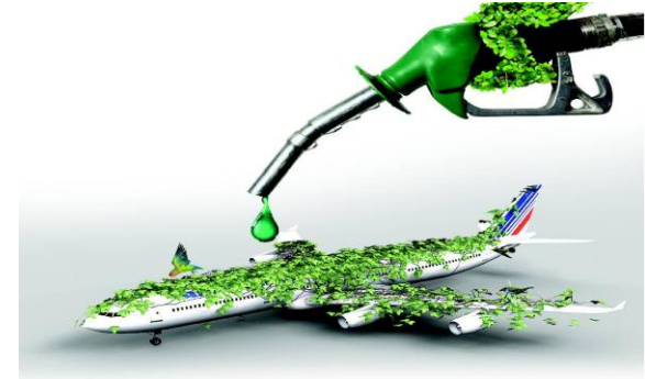
Sumber: Hubud, Pertemuan Stakeholder Consultation 2014

Level 4 mengasumsikan teknologi mesin pesawat telah mampu mengakomodasi penggunaan BBN murni sehingga pangsa penggunaan BBN murni di sektor transportasi udara pada tahun 2050 telah mencapai 50%.